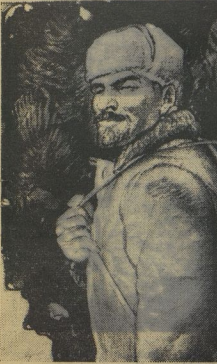
Рис. А. ЗУБОВА

Орган Центрального Комитета ВКМС и Центрального Совета Всесоюзной пионерской организации имени В. И. ЛЕНИНА