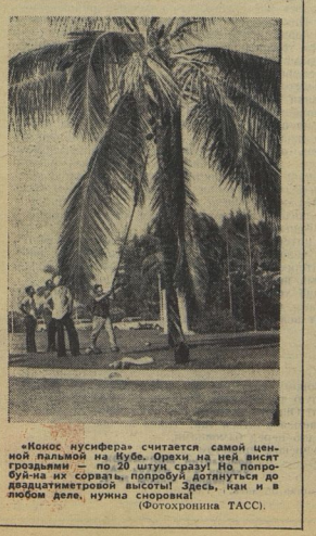
«Конюс мусиера» считается самой ценной палочкой на Кубе. Орехи на нем висят тысячами — по 20 сразу! На погребуй-на их сорвать, полюбуй достигаются до двадцатиметровой высоты! Здесь, как и в любом деле, нужна спорность. (Фотохроника ТАСС).